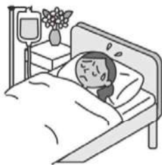
通り魔に遭遇し 重度後遺障害を被る