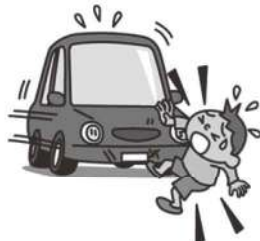
ひき逃げにあい 死亡する